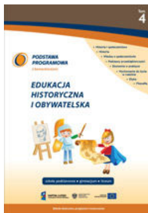
T. 4. Edukacja historyczna i obywatelska