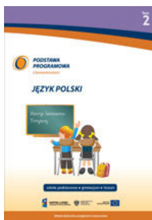
T. 2. Język polski