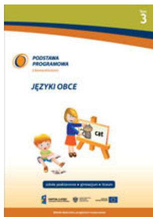
T. 3. Języki obce