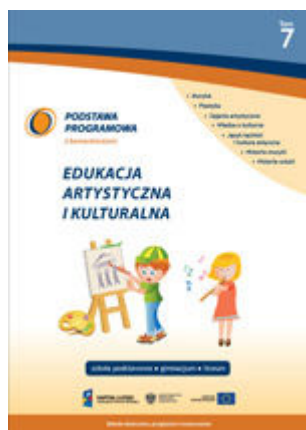
T. 7. Edukacja artystyczna i kulturalna