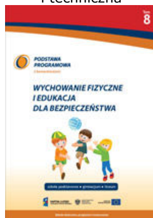
T. 8. Wychowanie fizyczne i edukacja dla bezpieczeństwa